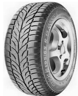
PAXARO 4x4 WINTER