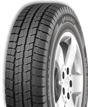
PAXARO VAN WINTER