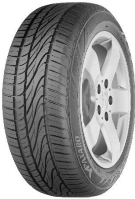
PAXARO SUMMER PERFORMANCE