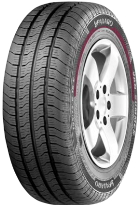
PAXARO VAN SUMMER