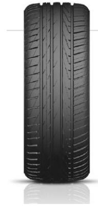
PAXARO RAPIDO / 4x4